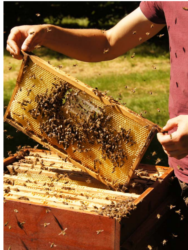
Die Wabe mit dem Käfig wird zentral in das Brutnest gehängt.

Vor der Säurebehandlung muss der Honig jedoch abgeerntet werden.