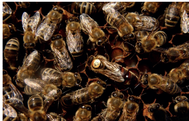
Sofort nach dem Freilassen wird die Königin von ihrem Hofstaat umringt.

Frühestens zwei bis drei Wochen vor Trachtende bis etwa Mitte August.