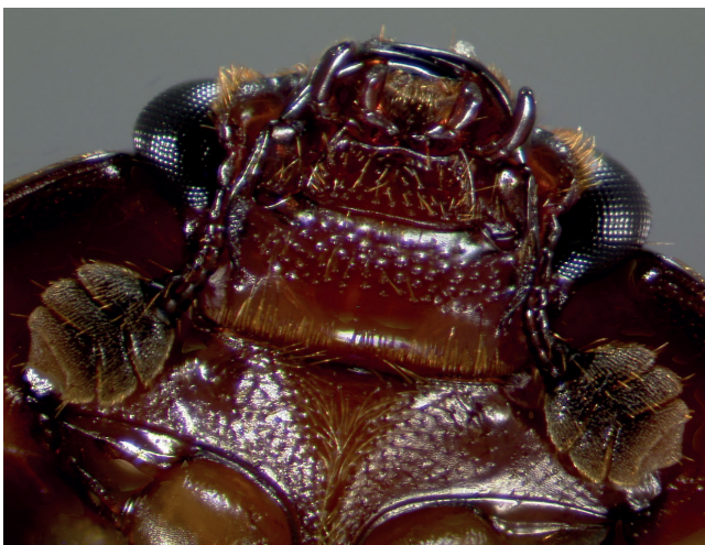
Abb. 4: Die keulenförmigen Fühler können zum Schutz eingeklappt werden.

Farbe: Unmittelbar nach dem Schlupf rötlich, später dunkel-braun bis schwarz (Abb. 4 und 5).