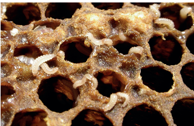
Abb. 8: Larven auf Brutwabe.

Verhalten: Wird das Volk geöffnet, lassen sich die Larven z. T. von der Wabe fallen und verstecken sich in den Spalten und Ritzen der Beute. Die Larven fressen Gänge in die Waben, sind aber auch an der Oberfläche zu finden (Abb. 8).