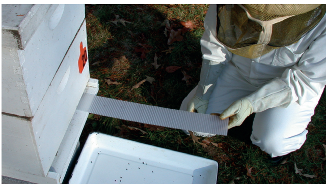
Abb. 2 a/b: Diagnose-Streifen sind sehr einfach in der Handhabung.