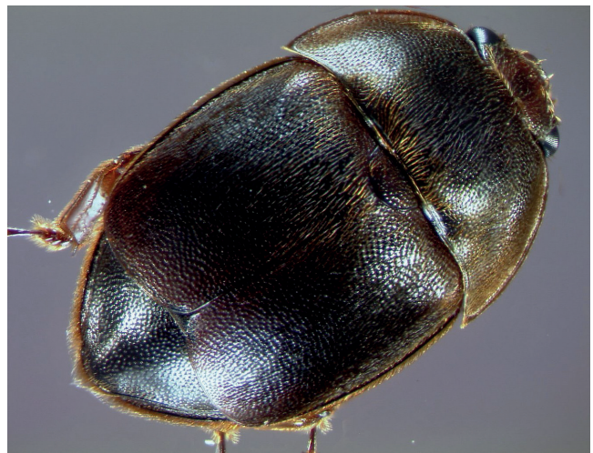
Abb. 5: Die Deckflügel sind kürzer als der Hinterleib.

Verwechslung: Der Glanzkäfer, Cychramus luteus , ein naher Verwandter des Kleinen Beutenkäfers, kann ebenfalls in Honigbienenstöcken vorkommen. Im Gegensatz zum Kleinen Beutenkäfer sind diese Käfer jedoch harmlos und richten keine ernsthaften Schäden an. Aufgrund der großen Ähnlichkeit besteht leicht die Gefahr einer Verwechslung mit dem Kleinen Beutenkäfer.