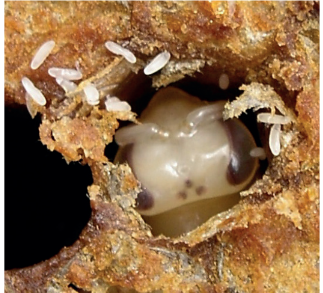
Abb. 6: Die Eier können direkt in die Brutzelle gelegt werden - der Zelldeckel wurde für das Foto geöffnet.

Beine: sechs voll entwickelte Beine in der unmittelbaren Nähe des Kopfes.