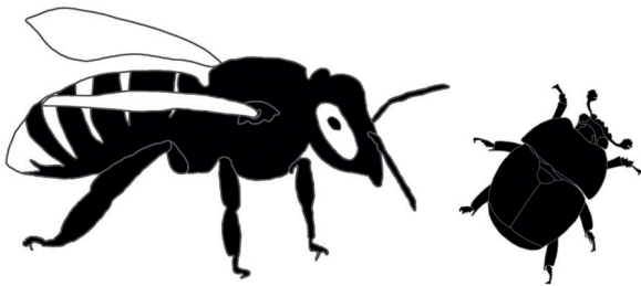
Abb. 3: Größenvergleich: Arbeitsbiene - adulter Käfer.

Größe: Ca. \frac{1}{3} so groß wie eine Arbeitsbiene (ca. 5 mm lang und 3 mm breit; Abb. 3).