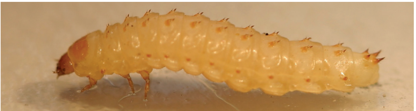
Abb. 7: Wanderlarvenstadium des Kleinen Beutenkäfers.