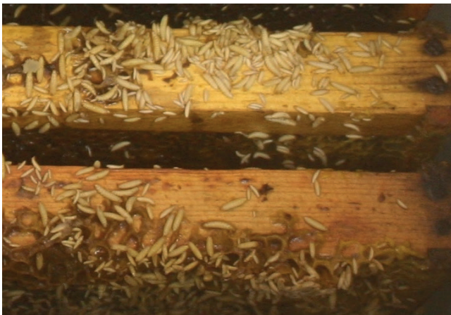
Abb. 10: Larven auf den Wabenträgern.

Wabenlager: Bei starkem Befall trockener Waben (Pollen und/oder Brut, aber kein Honig) verbleibt häufig nur noch ein schwärzliches trockenes Pulver (Fraßmehl) aus dem Kot der Larven und zerstörtem Wachs, das sich auf dem Boden der Beute anhäuft. In diesem Pulver können sich Larven und Käfer verstecken.